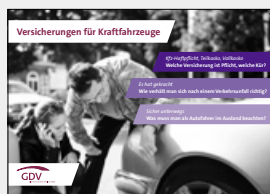
Versicherungen für Kraftfahrzeuge