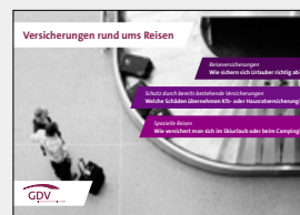
Versicherungen rund ums Reisen