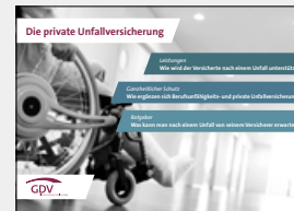
Die private Unfallversicherung