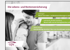
Die Lebens- und Rentenversicherung