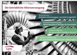
Die betriebliche Altersversorgung