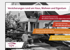
Versicherungen rund um Haus, Wohnen und Eigentum