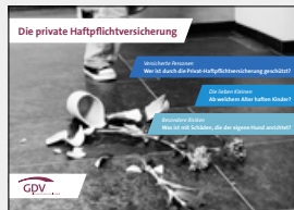
Die private Haftpflichtversicherung