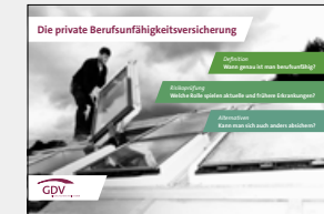
Die private Berufsunfähigkeitsversicherung